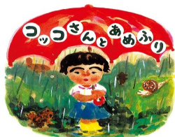
片山 健 さく・え

まいにち まいにち 雨ふりです。そこでコッコさんはてるてるぼうずをつくり、「あした てんきに してください」と願いますが、雨は止みません。コッコさんはてるてるぼうずの中に手紙を入れたり宝物をいっぱい入れたりしてお願いしますが、やっぱり雨は止みません。コッコさんはてるてるぼうずは疲れているのかとふとんをして休ませ、一緒に眠ります。そしてあくる朝は...！みずみずしい水彩の絵にコッコさんの思いが溶け込こむようです。コッコさんシリーズはどれも幼い子を見守る作者の眼がやさしい。